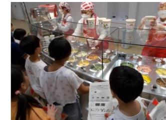
スープ・具材を選んでいきます