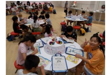
説明を聞きながらメモをとります