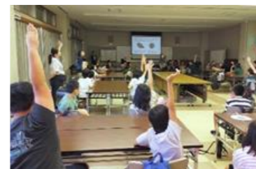
クイズは盛り上がりました

9月26日(木)は1・2くみが校外学習に行きました。行き先は、「森の未来館」と「じゅらくの里」でした。森の未来館では、まず森林(動物や植物)に関する3択クイズが10問出題されました(例「チガヤ」は「世界〇〇の雑草」と言われている。①最強 ②最弱 ③最高)。難しい問題もありましたが、全問正解している子どももいました。その後、クイズに出題されていた植物も含めて木の実やドライフラワー、葉、などを瓶に詰め、オイルを流し込んでハーバリウムを作りました。それぞれの個性が出た作品でどれも素晴らしかったです。