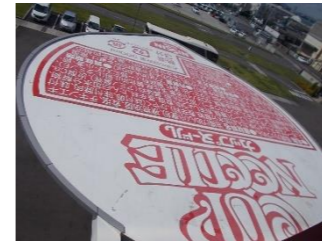
玄関の屋根はなんと7タ!

9月13日(金)に3年生が校外学習に行きました。行き先は、「日清食品関西工場」と「じゅらくの里」でした。日清食品関西工場は、とても広くてきれいで、子どもたちは驚いていました。麺を蒸してから、最後に梱包するまでの工程をほぼ無人で、200mものラインで製造しているところを見学しました。ほんのりとカップラーメンの香りが漂っていて「お腹減った～」と言っている子どももいました。また、4種類の味と12種類の具材から、自分好みの味にアレンジしたオリジナルカップラーメンを作りました。三雲小学校の3年生の人気No.1は「しょうゆ味」でした。よいお土産になりました。