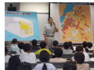
センターの方の説明を聞きませ

9月20日(金)は4年生が校外学習に行きました。行き先は、「湖南中部浄化センター」と「大津市科学館」でした。センターの方より、滋賀県には4つの浄化センターがあることや微生物によって水をきれいにしていることを説明していただきました。子どもたちは、説明を聞きながら熱心にメモをとっていました。その後、実際に処理している水を見学しました。大津市科学館では、プラネタリウムを見ました。滋賀県で見られる美しい星空や土星の輪に近づくダイナミックな動画を見ることができました。