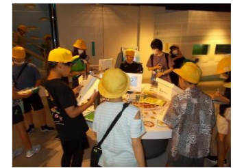
科学館では課題にも取り組み