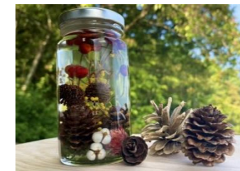
ハーバリウムはとってもきれい!