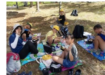
じゅらくの里でお昼ご飯