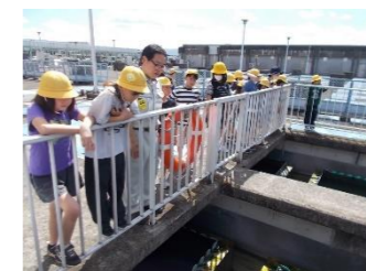
水がだんだんきれいになってい