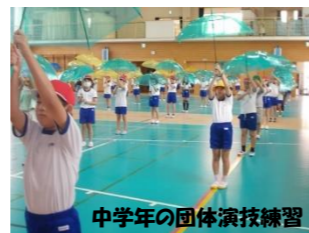
中学年の団体演技練習

9月下旬より暑さが和らいできました。三雲小学校では10月25日(金)に開催される運動会の練習が始まっています。特に、低学年(1・2年生)・中学年(3・4年生)・高学年(5・6年生)単位で取り組む団体演技は人数が多い活動ですので仕上がるまでに時間がかかります。組体操を行う5・6年生の高学年通心『絆』にこんなことが載っていました。