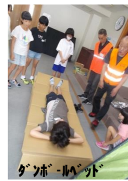
ダンボールベッド