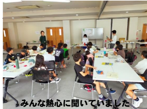
みんな熱心に聞いていました

防災体験学習では、簡易トイレに実際に座って使い方を学んだり、段ボールベッドを組み立てて寝心地を確かめたりしました。ここ最近の地震などのニュースを見聞きして、「他人事ではない」という実感があるのか、どの子も熱心に耳を傾けたり体験したりしていました。