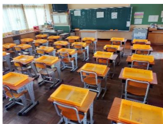
今日から学習も始まっています

さて、三雲小学校では9月~12月に運動会を始め校外学習や校内持久走記録会等、たくさんの行事があります。みくもっ子たちがたくさんの場面で輝いている姿を見せてくれることを楽しみにしています。