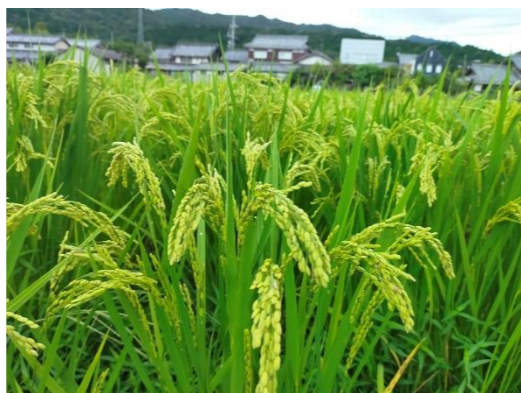
5年生が植えた稲はこんなに大きく育ちました

夏休みを終えて44日ぶりに、みくもっ子たちが元気よく登校してきました。ここ最近、夏休みを振り返る言葉として猛暑酷暑、危険な暑さ等、暑い夏であったことを伝える言葉がよく使われますが、今年も本当に暑い夏休みでした。今日からは、夏休みの生活から一気に変わります。生活リズムが戻るまで、時間がかかることでしょう。「早寝・早起き・朝ごはん」とよく言われますが、十分な睡眠をとり、朝ごはんをしっかり食べることが大切です。残暑も厳しくなることが予想されています。生活リズムをしっかり整え、健康で安全な学校生活を過ごしてほしいです。